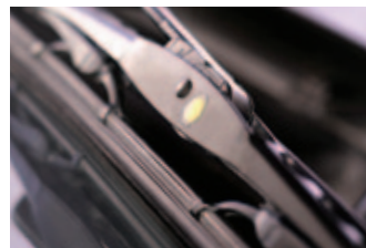
Opotřebený stěrač - nutná výměna